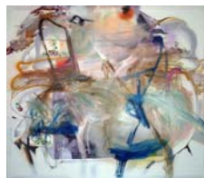
Albert Oehlen Juni – September 2013