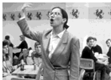
Konzept – Kontext Februar – Mai 2013