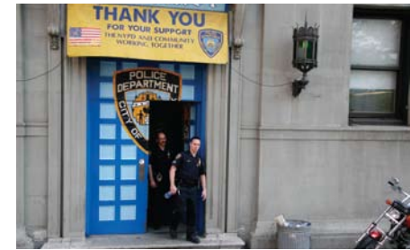
Aus: Eyeballing, 2005 © Rosalind Nashashibi