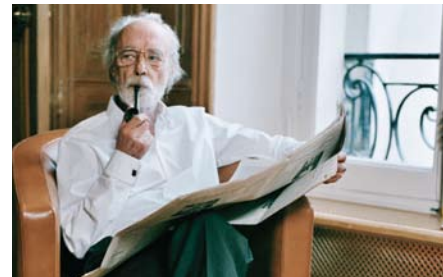
Aus: Homme à Femmes, 2004 © Gerard Byrne