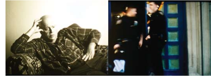
Aus: Bachelor Machines part 2, 2007 © Rosalind Nashashibi