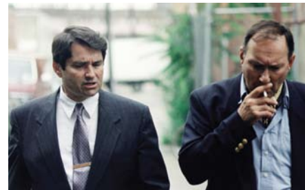
Aus: Why it's time for Imperial, again, 1998 - 2002